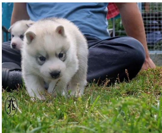
Gutt 1 «Solar»