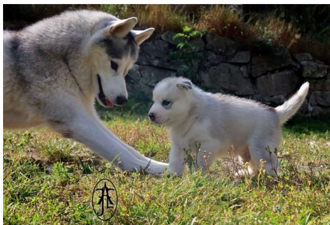
Gutt 2 «Stjernegutt»