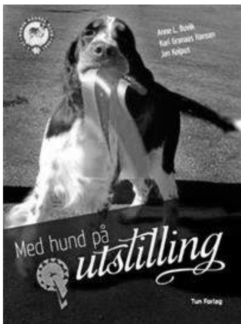
Bilde: Bok om hundeutstilling