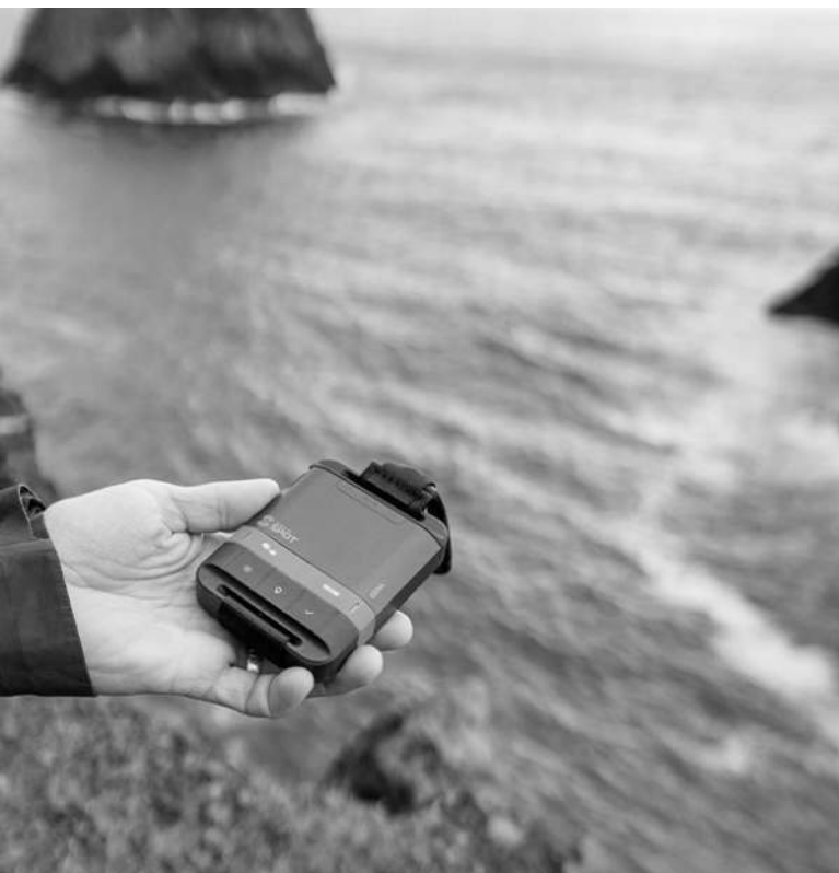
Bilde: Find me spot