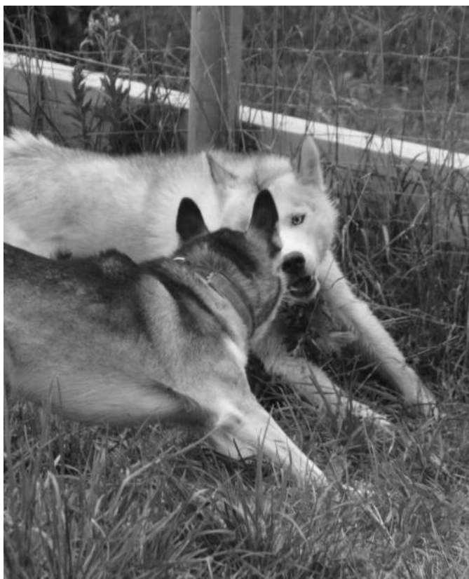
Bilde D: "Haren" gjør kast og vendinger for å komme seg unna