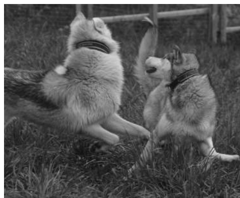
Bilder E: Jegerne samarbeider for å omringe "haren"