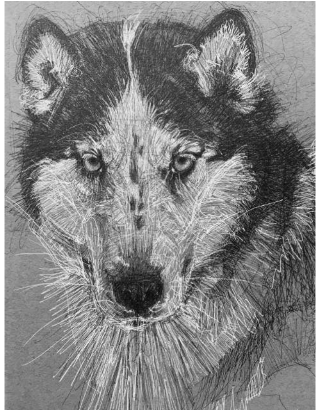
Bilde: Jan Kolpus