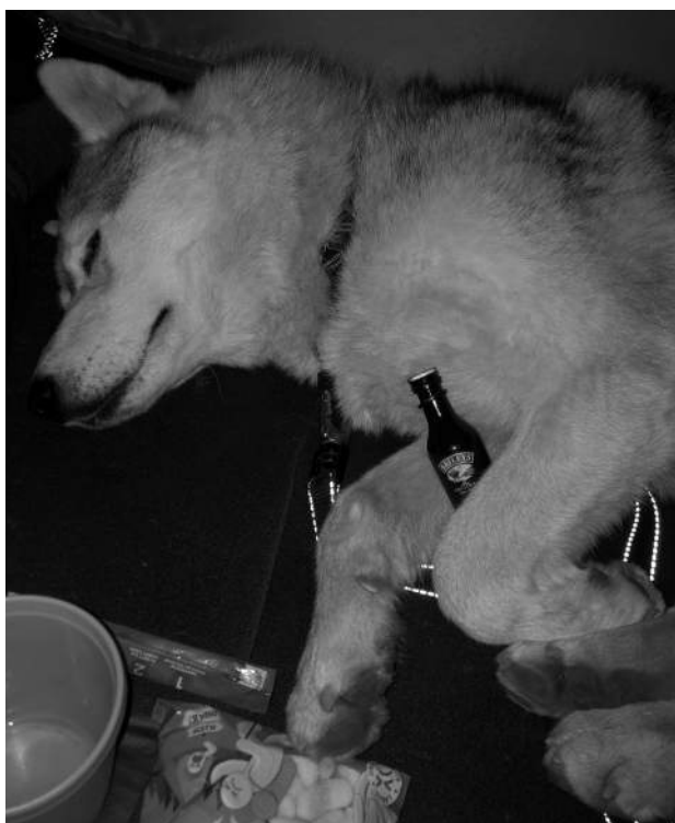
Bilde: Å variere kosten er fint, men ikke alt er like bra for hunden.

Når gradestokken viser blått, er holdbarhet sjeldent et stort problem, men er temperaturen mellom 0 til -5° så vil også frossen mat tine. På vinterstid er også transportalternativene en del enklere. Går du med pulk, eller du har flere hunder og bruker slede, er vekt et vesentlig mindre problem. Med pulk kjenner du ikke vekten på skuldrene, og i flatt terreng merkes ikke tyngden i vesentlig grad i forhold til om du bærer sekk.