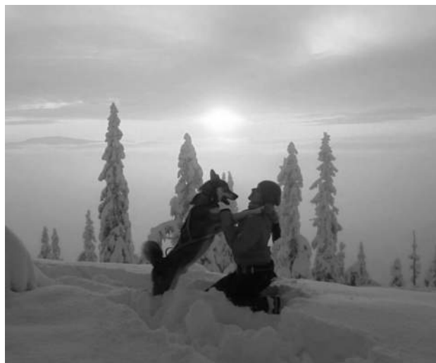
Bilde: Glade hunder på løp!

Denne Kompisen er absolutt smart nok til å skjønne når det lønner seg å høre på a`mor. Med godbiter i sikte har han hatt fullt fokus og imponert både eier og instruktører. Mer enn en gang har han fullført som beste aspirant (ifølge en heelt objektiv eier...). Sammen har vi klart både bronsemerke i lydighet og konkurrert i rallylydighet. Og det har vært SÅ gøy. Denne treningen har gitt oss en veldig fin kontakt, noe som jeg er sikker på er en fordel i andre sammenhenger også.