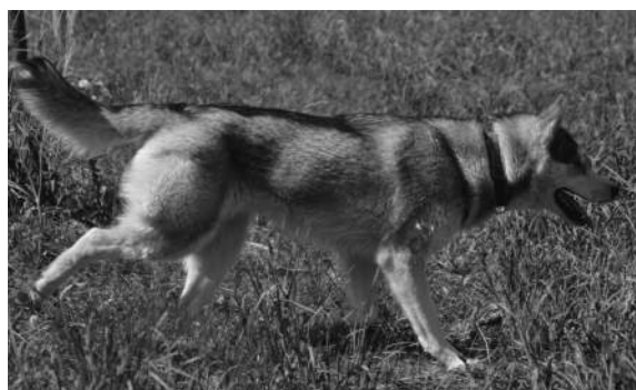
Bilde B: Lav holdning

Noe av den løpinga de driver med er ren jaktatferd. De velger en «hare» som en eller flere av de andre løper etter. Hvordan de velger hvem som skal være «hare» vet jeg ikke, men ofte ser det ut som «haren» velger det selv, og inviterer de andre til å være med. For eksempel kan de finne et «bytte» (en pinne e.l., se bilde A). De som er «jegere» får en lav holdning og fokusert blick (bilde B).