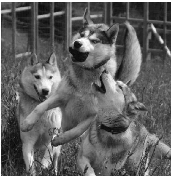
Bilde A: Pinnen fungerer her som et bytte

Når hundene mine er løse i løpegården hjemme er aktivitetene løping, lekeslossing, graving, se om det dukker opp noe utenfor gården, søke etter godbiter, tygge på pinner, bading (om sommeren).