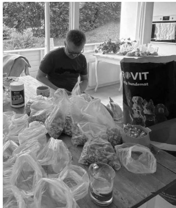
Bilder: Alt veies og pakkes og tilsettes vitaminer/mineraler.

På lengre turer er det lurt å pakke ferdige porsjonspakker på forhånd, beregne for antall dager og legge til en buffer. Er det lang tur, kan det være lurt å pakke noen ekstra porsjoner for å spe på “standardrasjonene”. Pakker du på forhånd, har du mye bedre kontroll på hvor mye du gir og på hvor mange dager du har igjen.