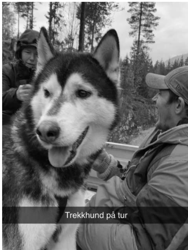
Trekkhund på tur