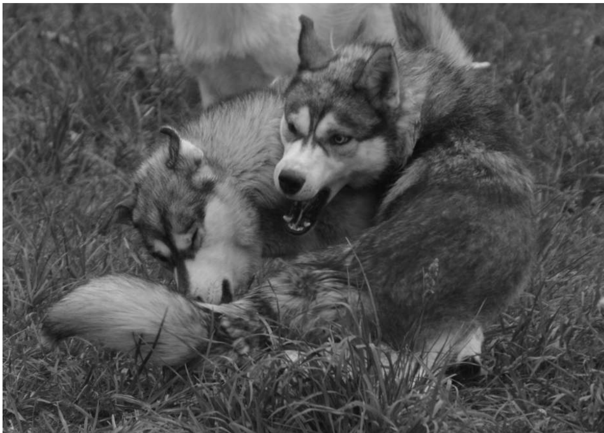
Bilde C: Dynamikken mellom jeger og "haren"