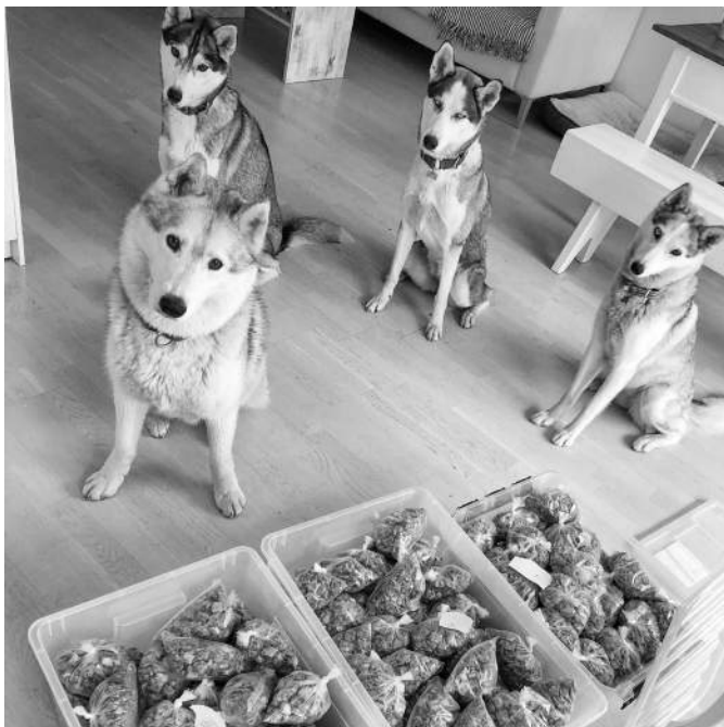
Bilde: Ferdige porsjonspakker til fire bikkjer for 3 uker.

temperaturer som gjør det umulig å ta med frossen- eller fersk kjøttmat. På dagstur går det fint med kjøtt eller frossen mat. Tiner den i løpet av dagen har ikke dette noen betydning.