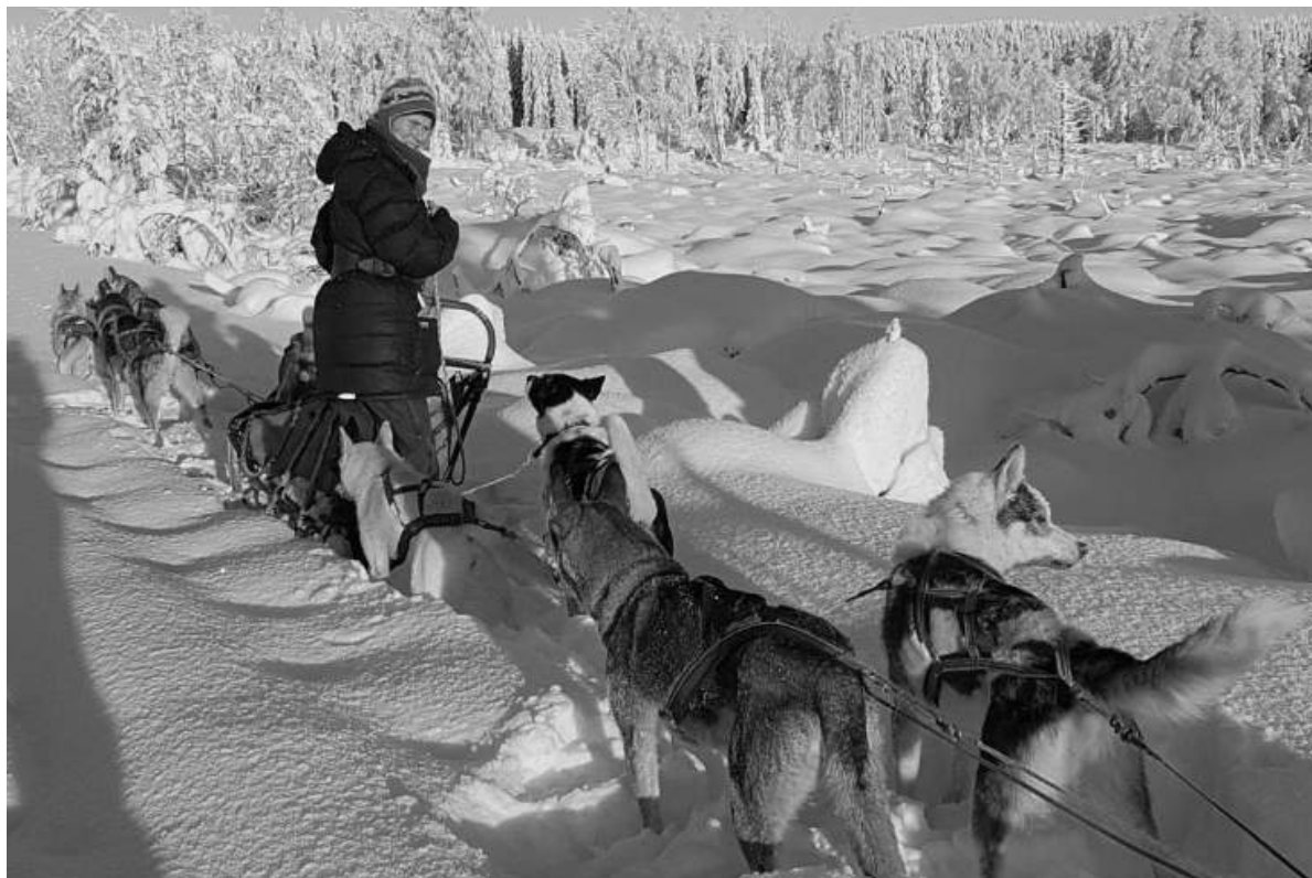
Bilde: Varierende stikvalitetet og underlag gjør turen artig for hunder og folk.